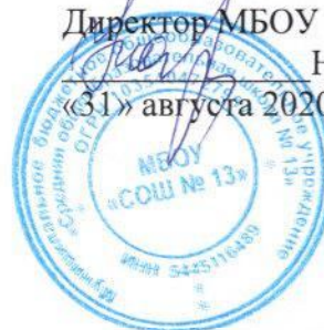
График работы учителя-логопеда МБОУ СОШ № 13 в 2020-2021 учебном году